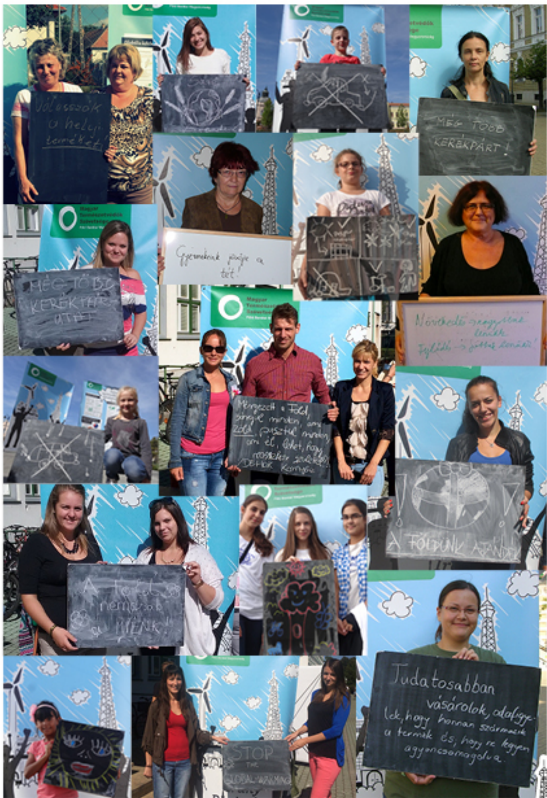
Hazai fotó-üzenetek a párizsi ENSZ klímacsúcsra