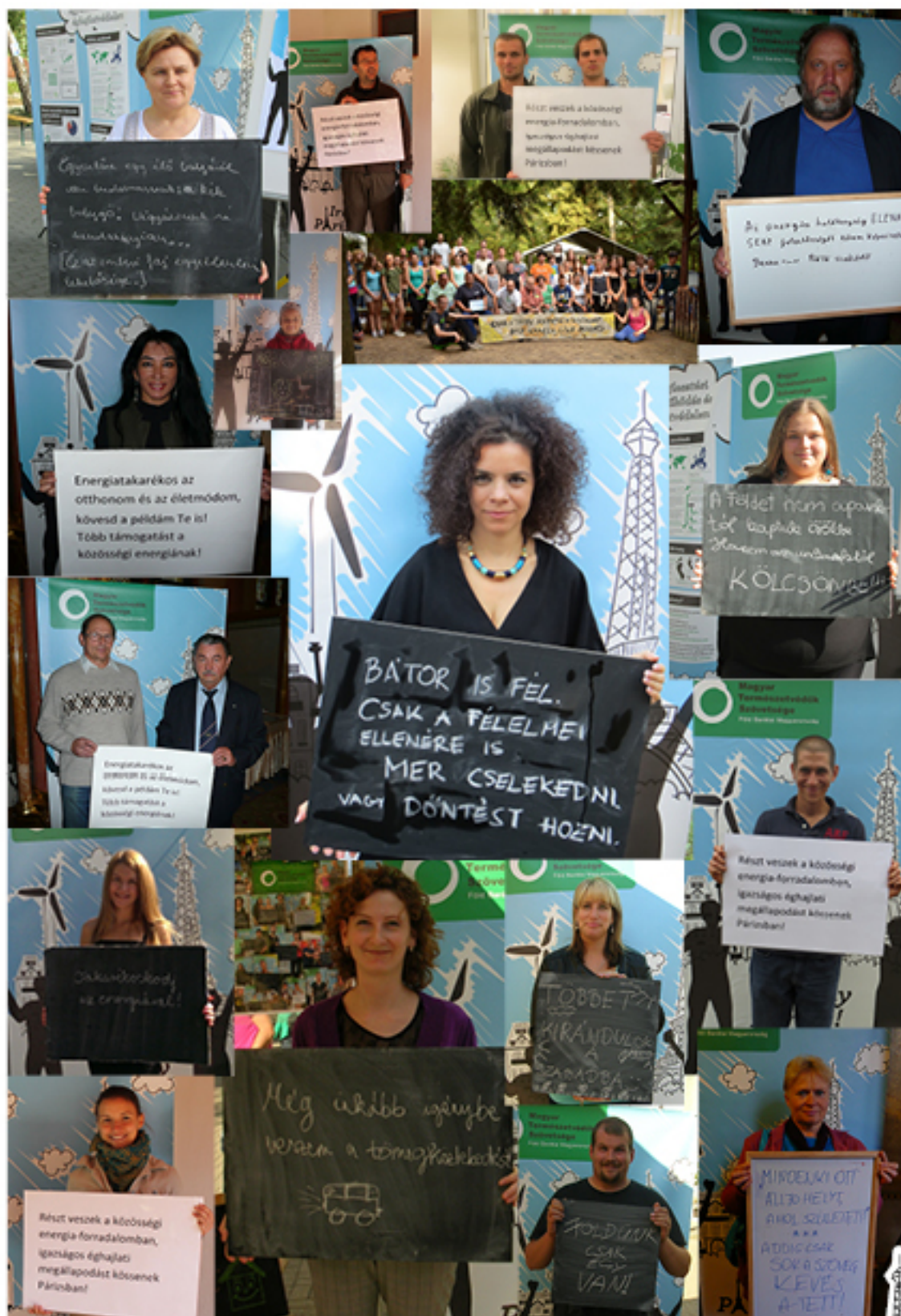
Hazai fotó-üzenetek a párizsi ENSZ klímacsúcsra