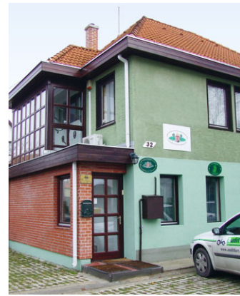
Kívül-belül megújult a kamarai székház

Az elnök leszögezte, mindezekkel a lépésekkel megteremtették a kamara anyagi bázisát, a korszerű munkavégzés lehetőségét, valamint a kamarai tagok által igényelt szolgáltatások biztosítását. Miután a bázis adott, a következő években a szakmai munkára kívánunk nagyobb hangsúlyt fektetni. Ha tagok ezután is úgy állnak a szervezet mögött, mint tették ezt eddig, akkor továbbra is szép jövője lesz a Veszprém megyei vadász-kamarának.