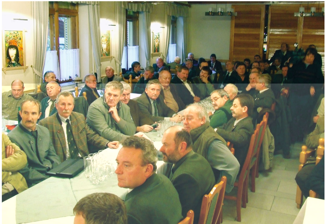
Az elhangzottak nagy érdeklődést váltottak ki

Az elnök örömeinek adott hangot, hogy idén már ismét a komoly szakmai munka került előtérbe, így a megye vadásztársadalma visszanyerte vezető helyét. A vadgazdálkodási tevékenység terén az országban a harmadik-negyedik helyen jegyzik megyénket. Szerinte akár még jobb eredményeket is tudnának produkálni, de csak a 2400 kamarai taggal együttesen. A közös célokért érdemes tenni, áldozatokat hozni.