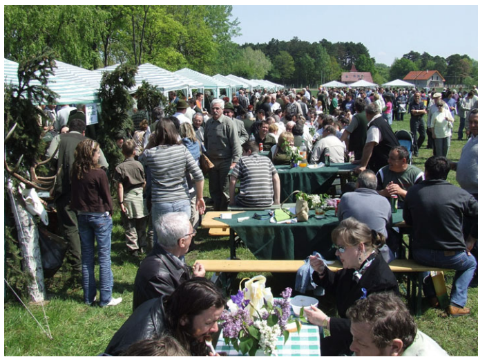
Különleges trófeákat mutattak be a vadásznapi kiállításon

Idén is zajos sikert aratott a Veszprém megyei vadásznapi, amely a pápai Szent-György-napi Agrárrepxo szertő részért vált az elmúlt években, sőt – bátrán kijelenthetjük – a rendezvény leglátogatottabb eseménye.