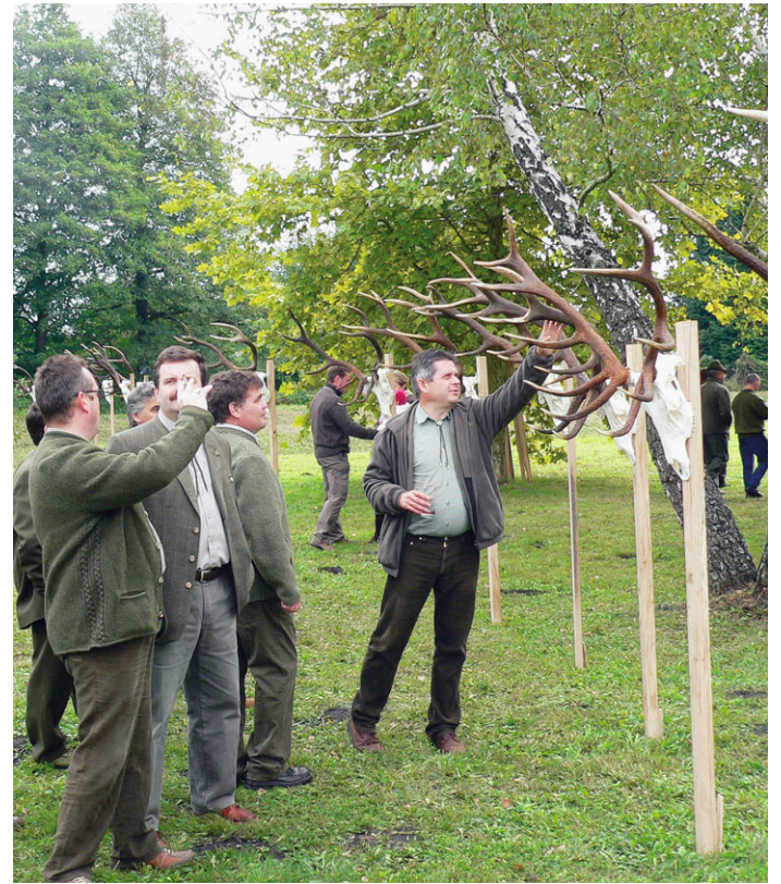
Szemre igencsak tetszetős volt a több, mint 100 trófea

Mindezek mellett szeptemberben 160 szarvasbika került terítékre, ugyanannyi, mint tavaly. Ugyanakkor megfigyelhető az átlagsúlyok gyarapodása. Míg 2005-ben 5,6-, 2006-ban 5,8-, 2007-ben hat kilogramm volt a trófeák átlagsúlya, ez az idén 6,1-re emelkedett, ami öröndetes. Szintén jónak mondható az érmesek 40 százalékos aránya. 20 darab nyolc-, kilenc darab kilenc-, és három darab tíz kiló feletti bikájuk volt. A legnagyobbak: 10,4 (Monostorapáti), 10,39 (Farkasgyepű), 10,33 (Devecser). Megfigyelhető a hazai vendégvadászok térhódítása, a két legnagyobb bikát is magyarok ejtették. Az éves tervek 284 bika, amiben természetesen a selejtezés is szerepel. Ma úgy látszik, a terv teljesítése nem ütközik nehézségekbe.