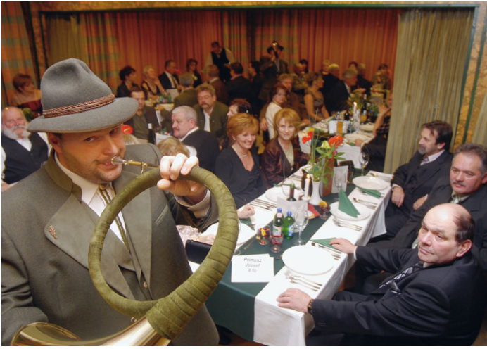
A megyei vadászbálon a hangulat garantált