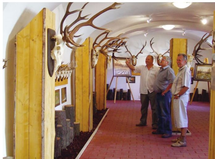
A megye második állandó trófeakiállításának a sümegi püspöki palota ad otthont