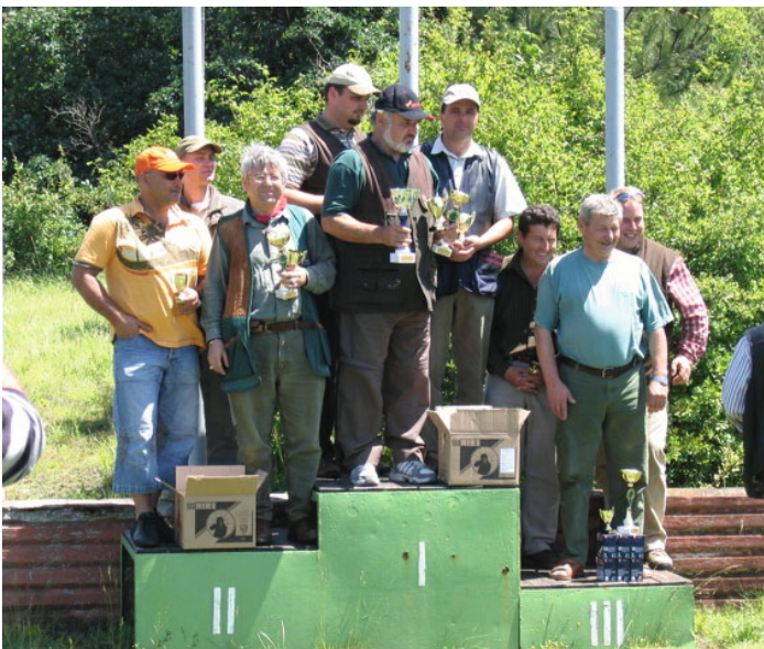
Egyéniben és csapatban is szertő eredményt hozott a verseny

Ma már nagyon komoly rangja van a Vadászkamarai Nagydíj lövészversenynek, amit bizonyít az évek óta tartó fokozott érdeklődés. Idén egyéniben és csapatban is szertő eredményt szertőtt.